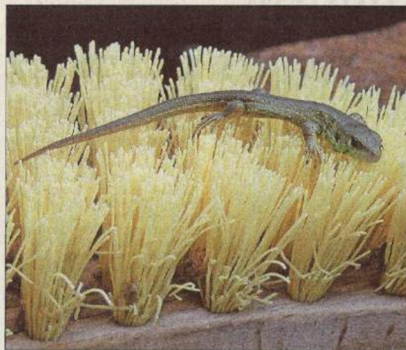
Leser fotografieren (2063): Außergewöhnlichen Besuch hatte Familie Lepsch in Böhl-Iggelheim kürzlich in ihrem Garten und hat uns daraufhin diese Aufnahme einer Eidechse geschickt. Sie sonnt sich gerade auf einer Wurzelstube.