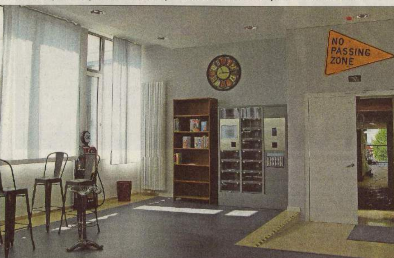
Noch sind die Stühle im „Freiraum“ unbesetzt. Beim Aktionstag herrscht hier aber mit Sicherheit reges Treiben.

Weitere Informationen und das vollständige Programm gibt es im Internet unter www.lud-wigshafen.de/lebens-wert/stadtbibliothek. jmsw